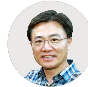
김영표 신한저축은행 대표

입사해 처음으로 각 사의 직원들과 함께 하면서 받는 신입 행원 연수는 직장 생활에 큰 영향을 줍니다. 또한 이 시간은 인생에서 결코 다시 돌아오지 않는 시간입니다. 멋지고 의미 있는 시간으로 만들었을 것으로 생각합니다. 신입 행원 여러분들 모두가 업계의 빛나는 보석이 되길 바랍니다. ‘어딘가 내가 모르는 곳에/ 보이지 않는 꽃처럼 웃고 있는/ 너 한 사람으로 하여 세상은/ 다시 한 번 눈부신 아침이 되고/ 어딘가 내가 모르는 곳에/ 보이지 않는 풀잎처럼 숨 쉬고 있는/ 나 한 사람으로 하여 세상은/ 다시 한 번 고요한 저녁이 된다/ 가을이다 부디 아프지 마라’ 나태주 시인의 시 구절입니다. 일과 공부, 여가 활동 등 아무리 하고 싶은 일이 많아도 건강이 허락하지 않으면 불가능합니다. 건강은 반드시 지켜야 하는 것이고, 그래야 원하는 것을 이루고 누릴 수 있습니다. 건강하게 그리고 유익하게 의미 있는 시간으로 만들어 저축은행업계를 이끌어 갈 큰 재목으로 성장하길 진심으로 바라겠습니다.